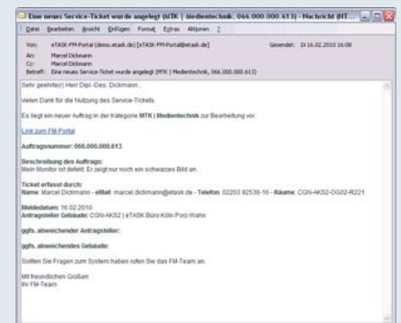
eTASK.Service-Ticket: Einfache Bedienung und zielgerichtete Kommunikation bei allen Serviceanfragen Oben: Anlegen eines Service-Tickets, Links: Serviceliste des Anwenders, Rechts: automatische Benachrichtigungs-E-Mail